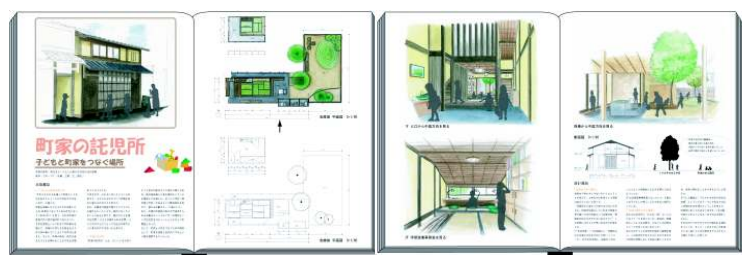
子供達が五感で町家の空間を体験できる託児所の提案