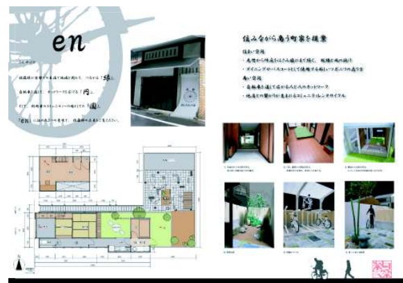
レンタルサイクルの提案