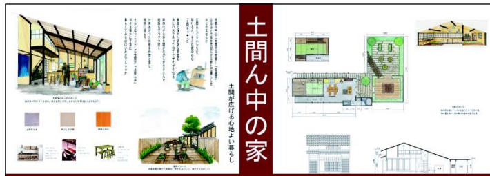
土間を再現し、おくどさんを使った自給自足の生活を提案