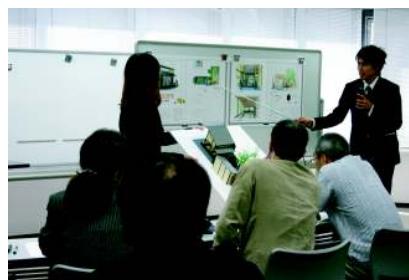
クライアントプレゼン